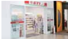
■ コンビニエンスストア