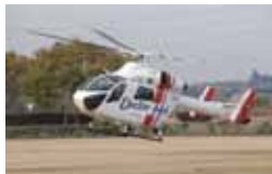
▲ 防災広場の有効活用

物流施設と防災広場を活用し、官民一体となって安全・安心のまちづくりを推進することを目的に、本協定書を締結しました。