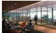
■ サテライトオフィス