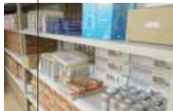
▲ 防災備蓄倉庫の設置