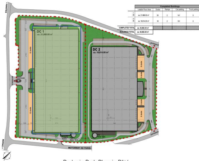
Prologis Park Plessis-Pâté

Disponibilité : 1 er janvier 2023 – dérogoire