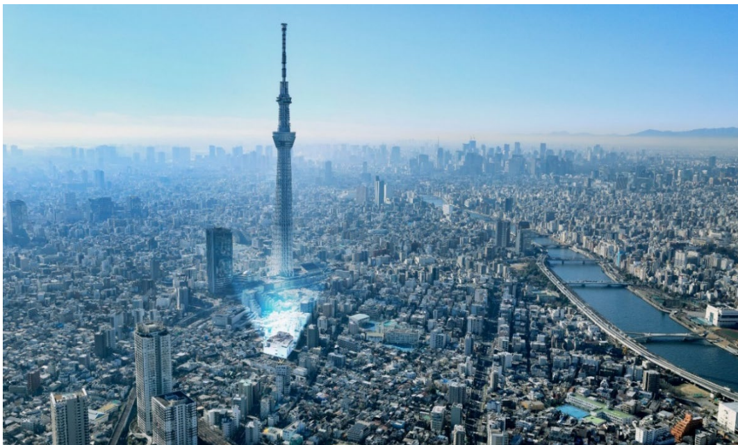
「プロロジスアーバン東京押上1」周辺 航空写真

周辺には東京ソラマチをはじめとする商業施設や店舗が立地し、車5分圏内には約5万人が居住。周辺商業施設への店舗間配送や、ECフルフィルメント拠点、ダークストアとしての利用ニーズが想定されるほか、城東・城北エリアへの即日配送やラストワンマイル拠点としても理想的な立地であると言えます。