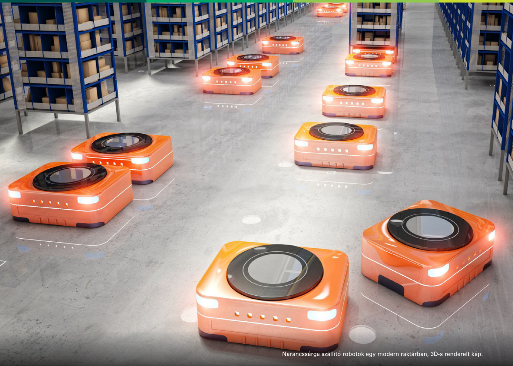
Narancssárga szállító robotok egy modern raktárban, 3D-s renderelt kép.

Az e-kereskedelem elmúlt évtizedben lezajlott térnyerése megmutatta, hogy milyen fontos szerepet játszanak a logisztikai ingatlanok az ügyfeleink jövedelemtermelő képessége szempontjából. A logisztikai iparág szereplőinek egyre nagyobb b az igénye a megfelelő helyszínen lévő és a megfelelő funkciókkal ellátott megfelelő épületekre ahhoz, hogy optimálisan ki tudják használni a folyamatosan változó ellátási láncokban rejlő lehetőségeket, amelyek révén versenyelőnyhöz juthatnak. Az automatizálás megnyitja ezt a potenciált.